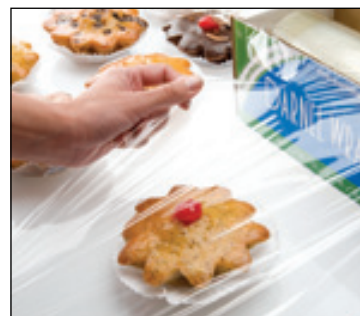
Fácil de manejar

* Más micrajes / largos / anchos / consultar.