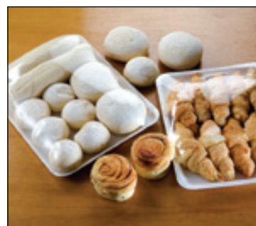
Mantiene los alimentos más frescos