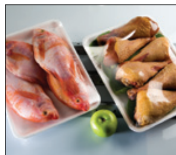
Película transpirable, permite mayor conservación de los alimentos